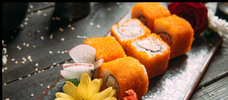
КАЛИФОРНИЯ РОЛЛ ..... 569 КРЕВЕТКИ ТОБИКО АВОКАДО, ОГУРЕЦ, МАЙОНЕЗ