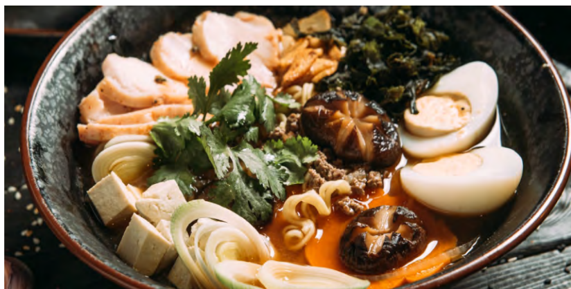
РАМЕН С КУРИЦЕЙ .....419