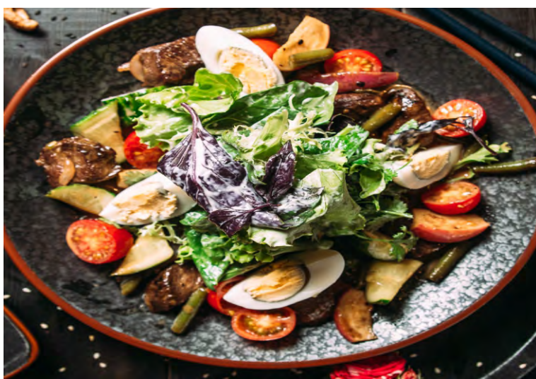
САЛАТ С ГОВЯДИНОЙ В ПИКАНТНОМ СОУСЕ.....359 СО СТРУЧКОВОЙ ФАСОЛЬЮ, ПОМИДОРАМИ ЧЕРРИ, РЕДИСОМ И КУРИНЫМ ЯЙЦОМ