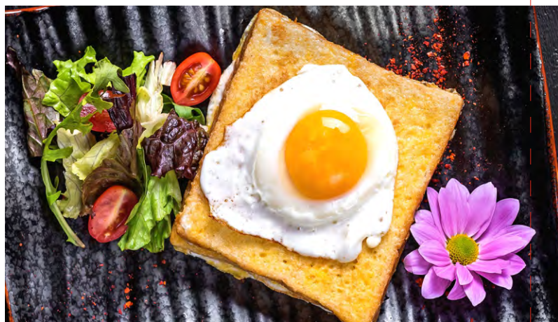
КРОК МАДАМ ..... 239 СЭНДВИЧ С ЯЙЦОМ, СЫРОМ, ВЕТЧИНОЙ И ГОРЧИЦЕЙ