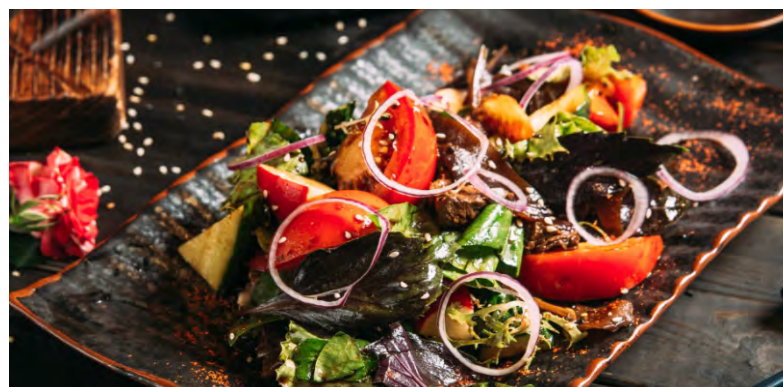
САЛАТ ВОСТОЧНЫЙ.....339 С ОГУРЦОМ, РЕДИСОМ, СПЕЛЫМИ ПОМИДОРАМИ И ЗАПЕЧЕННОЙ ГОВЯДИНОЙ, ЗАПРАВЛЕННЫЙ СОЕВЫМ СОУСОМ