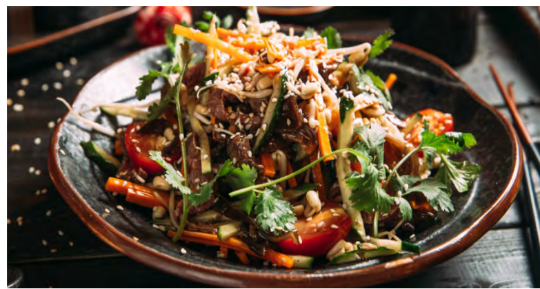
САЛАТ ПАТТАЙ .....589 ИЗ СВЕЖИХ ОГУРЦОВ, МОРКОВИ, ПОМИДОРОВ ЧЕРРИ, С ДРЕВЕСНЫМИ ГРИБАМИ И ПРОРОСШИМИ БОБАМИ, ЗАПРАВЛЕННЫЙ КИСЛО-СЛАДКИМ СОУСОМ