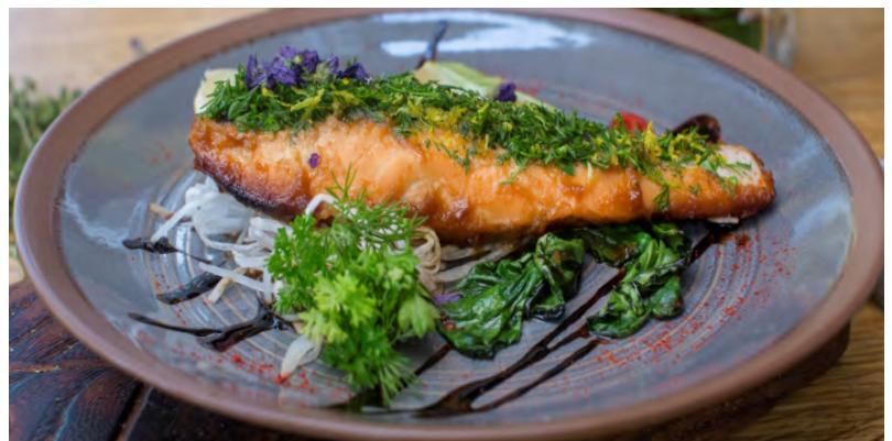
ЛОСОСЬ В СТИЛЕ НОБУ .....789 ЛОСОСЬ, ПАК- ЧОЙ, ДАЙКОН, МИСО-КАРАМЕЛЬ