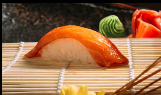
СУШИ ЛОСОСЬ ..... 129