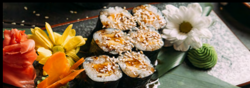
РОЛЛ С ОМЛЕТОМ.....189