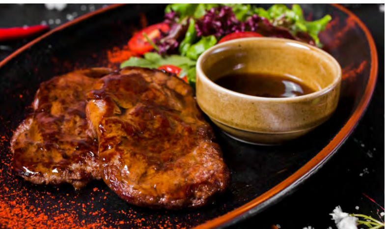
БИФ ТЕРИЯКИ .....549 КУСОЧКИ ГОВЯДИНЫ, ТУШЕННЫЕ ПОД СОУСОМ ТЕРИЯКИ, ПОДАЮТСЯ С МИКС-САЛАТОМ