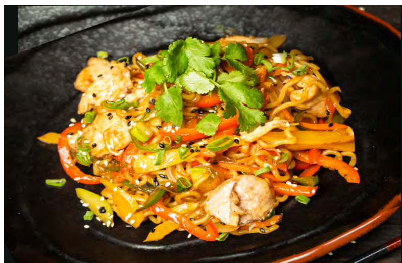
ЯКИСОБА ТОРИ .....459 ПШЕНИЧНАЯ ЛАПША, ОБЖАРЕННАЯ С КУСОЧКАМИ КУРИНОГО ФИЛЕ И ОВОЩАМИ В ФИРМЕННОМ СОУСЕ