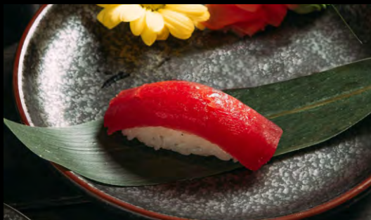
СУШИ ТУНЕЦ..... 149