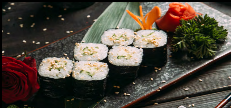
РОЛЛ С ОГУРЦОМ .....189