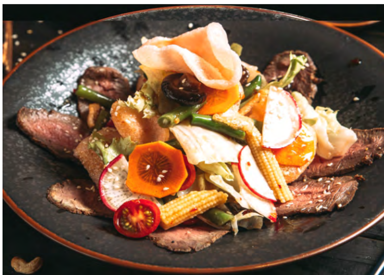
САЛАТ С ГОВЯДИНОЙ ПО-СИНГАПУРСКИ.....409 С ЛИСТЬЯМИ АЙСБЕРГА, ГРИБАМИ ШИИТАКЕ, ПОМИДОРАМИ ЧЕРРИ, СТРУЧКОВОЙ ФАСОЛЬЮ И КРЕВЕТОЧНЫМИ ЧИПСАМИ