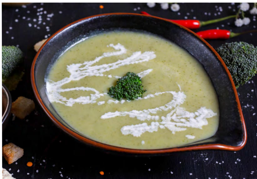
СУП С БРОККОЛИ И ЦВЕТНОЙ КАПУСТОЙ ..... 189