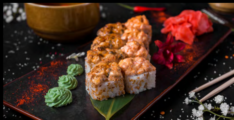
ЗАПЕЧЕННЫЙ ДУЭТ ..... 639 УГОРЬ, ЛОСОСЬ, СЫР ФИЛАДЕЛЬФИЯ, ОГУРЕЦ, КУНЖУТ, СОУС ФИРМЕННЫЙ