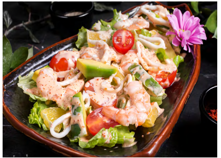
МИСАТО САЛАТ.....419 КАЛЬМАРЫ, КРЕВЕТКИ, АВОКАДО, АПЕЛЬСИН, ПОМИДОРЫ ЧЕРРИ, ЗАПРАВЛЯЕТСЯ ЯПОНСКИМ СОУСОМ НА ОСНОВЕ ТОБИКО