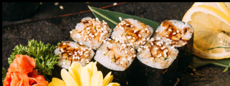
РОЛЛ С УГРЕМ .....409