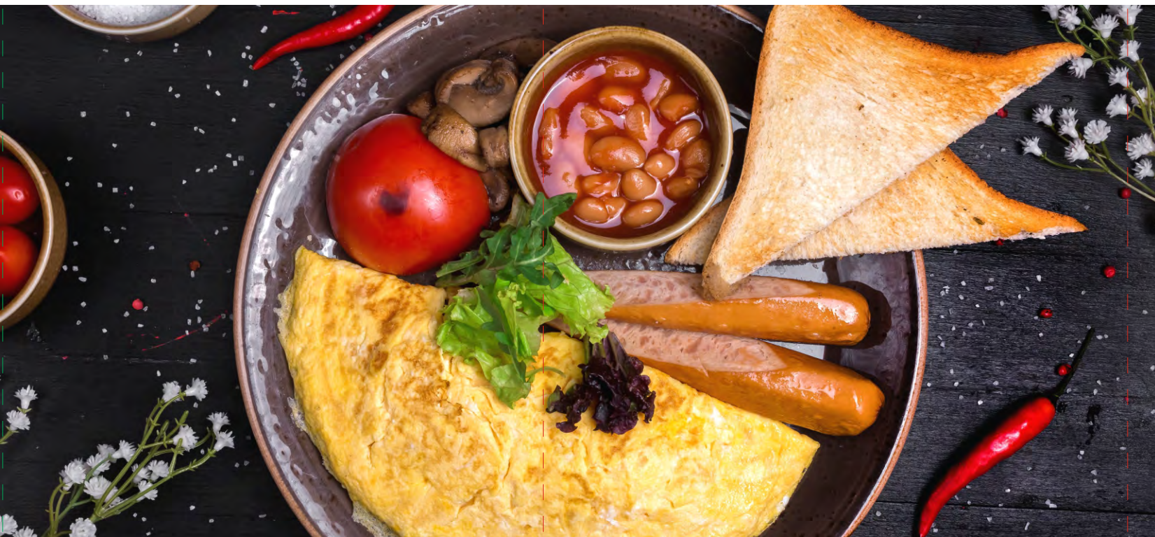
ЗАВТРАК «СЫТНЫЙ» ..... 369 КУРИНЫЕ КОЛБАСКИ С ШАМПИНЬОНАМИ И ПОМИДОРОМ, ФАСОЛЬЮ В ТОМАТЕ, КЛАССИЧЕСКИМ ОМЛЕТОМ