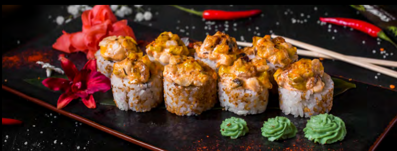
ОСАКА РОЛЛ ..... 579 СЫР ФИЛАДЕЛЬФИЯ, АВОКАДО, ТАМАГО, УГОРЬ, ОКУНЬ, СОУС ФИРМЕННЫЙ