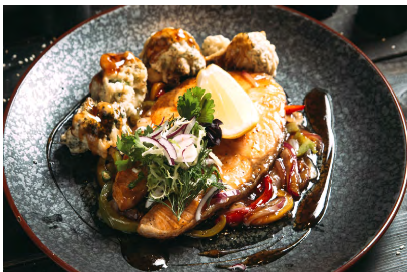
ЛОСОСЬ, ЗАПЕЧЕННЫЙ ПОД СОУСОМ ТЕРИЯКИ С ОВОЩАМИ .....819