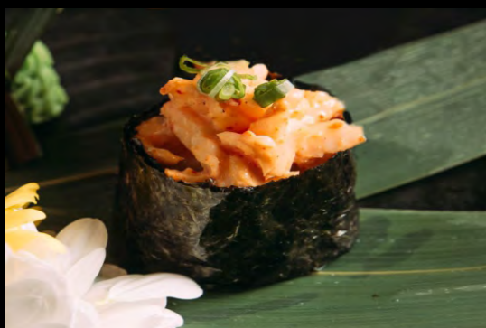
СПАЙСИ СУШИ С КРЕВЕТКОЙ ..... 139 КРЕВЕТКА, СПАЙСИ СОУС, ЗЕЛЕНЬ ЛУК