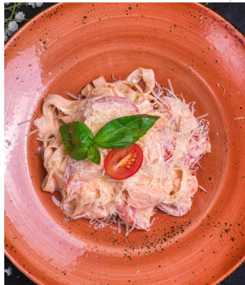
ФЕТТУЧИНИ С СЕМГОЙ .....449 ЛАПША ФЕТТУЧИНИ С СЕМГОЙ ПОД ТОМАТНО-СЛИВОЧНЫМ СОУСОМ