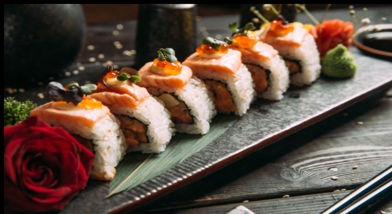
CRAZY SALMON РОЛЛ ..... 719 ЛОСОСЬ СПАЙСИ, АВОКАДО, КУНЖУТ, ИКРА ЛОСОСЯ, ЗЕЛЕНЬ, МАЙОНЕЗ ЯПОНСКИЙ