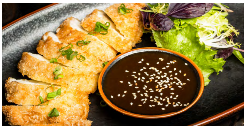
ТОРИ КАТСУ .....429 КУРИНОЕ ФИЛЕ В ХРУСТЯЩЕЙ ПАНИРОВКЕ С СЫРОМ МОЦАРЕЛЛА