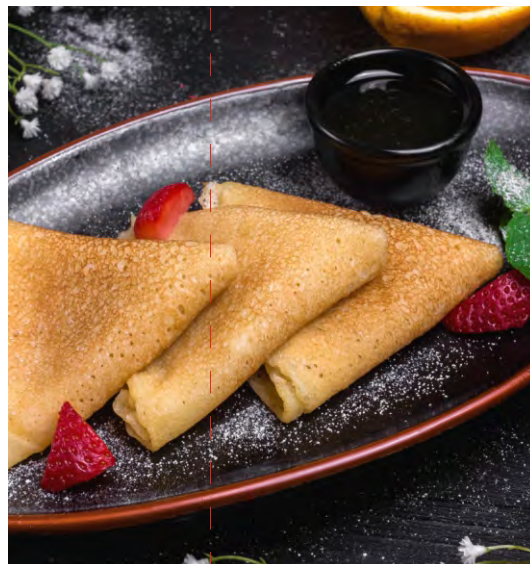
БЛИНЫ С МЕДОМ/СО СМЕТАНОЙ/С ДЖЕМОМ.....189