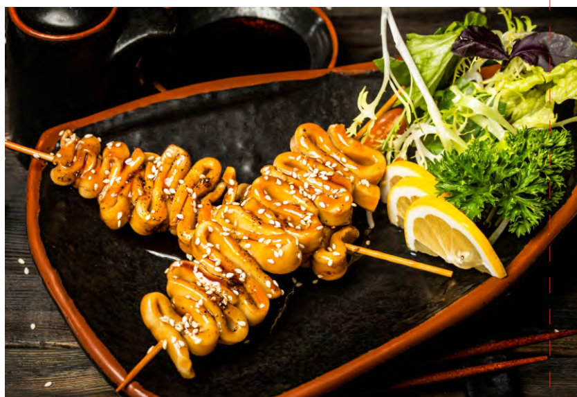
ШАШЛЫЧКИ ИЗ КАЛЬМАРОВ.....369 В СОУСЕ ТЕРИЯКИ