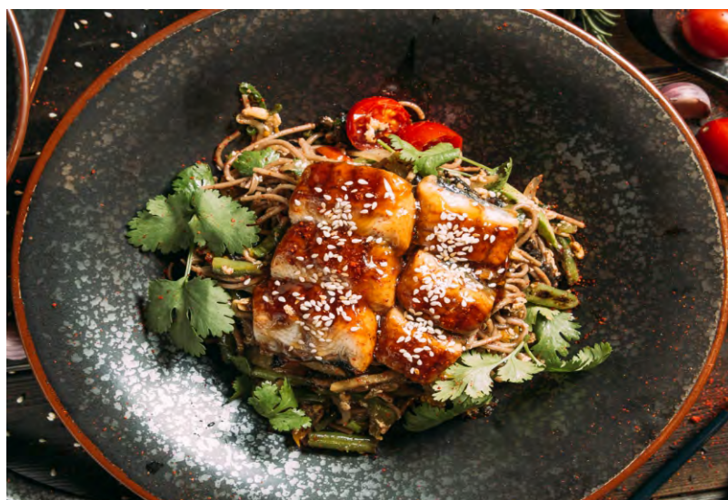
СОБА С УГРЕМ .....689