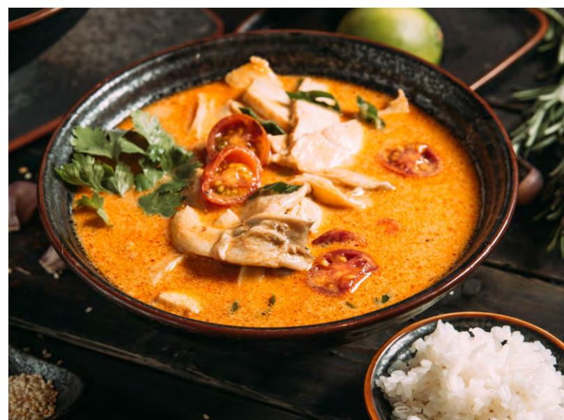
ТОМ ЯМ КАЙ ..... 439 ТАЙСКИЙ ПИКАНТНЫЙ СУП НА ОСНОВЕ ГАЛАНГАЛА, ЛЕМОНГРАССА, ЛИСТА КАФИРЛАЙМА, КОКОСОВОГО МОЛОКА И КУРИНОГО БУЛЬОНА С ВЕШЕНКАМИ И КУРИНЫМ ФИЛЕ