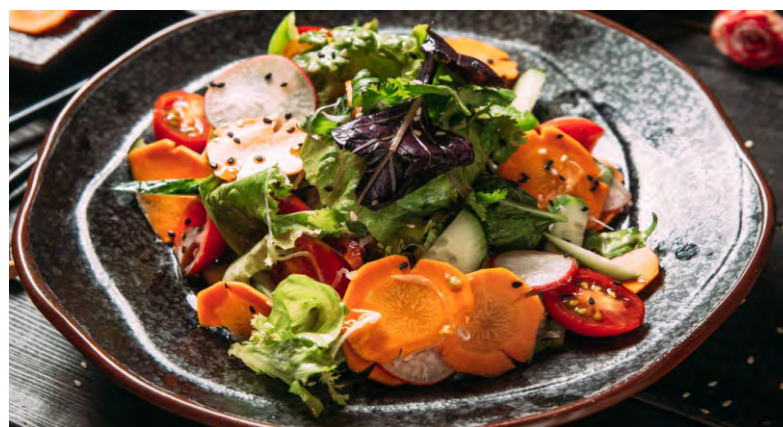
САЛАТ ЯССАЙ .....249 С ПОМИДОРАМИ ЧЕРРИ, СВЕЖИМ ОГУРЦОМ, МОРКОВЬЮ, РЕДИСОМ, С ЯПОНСКОЙ РЕДЬКОЙ И РУККОЛОЙ, ЗАПРАВЛЕННЫЙ КИСЛО-СЛАДКИМ СОУСОМ НА ОСНОВЕ РИСОВОГО УКСУСА