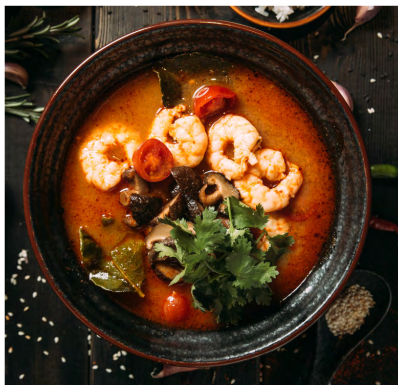
ТОМ ЯМ КУНГ .....459 ТАЙСКИЙ ПИКАНТНЫЙ СУП НА ОСНОВЕ ГАЛАНГАЛА, ЛЕМОНГРАССА, ЛИСТА КАФИРЛАЙМА И КУРИНОГО БУЛЬОНА, С ГРИБАМИ ШИИТАКЕ И ТИГРОВЫМИ КРЕВЕТКАМИ