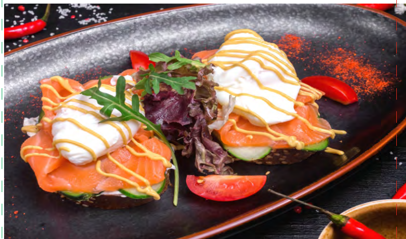
ЯЙЦО ПАШОТ НА РЖАНОМ ХЛЕБЕ ..... 219 ЛЕГКИЙ ЗАВТРАК С МАЛОСОЛЕННОЙ СЕМГОЙ НА РЖАНОМ ХЛЕБЕ, С ОГУРЦОМ И ПОМИДОРАМИ ЧЕРРИ, С ГОРЧИЦЕЙ