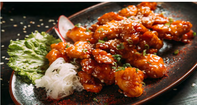
КУРИЦА ТОРИ .....389 ЖАРЕННЫЕ КУСОЧКИ КУРИЦЫ В КИСЛО-СЛАДКОМ СОУСЕ