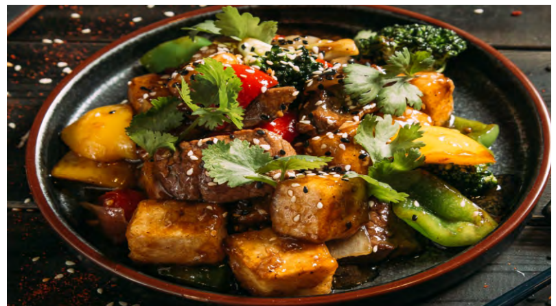
ТОФУ ПО-ДОМАШНЕМУ .....399 С ГОВЯДИНОЙ, БРОККОЛИ, ПОМИДОРАМИ ЧЕРРИ, ЧЕСНОКОМ И БОЛГАРСКИМ ПЕРЦЕМ