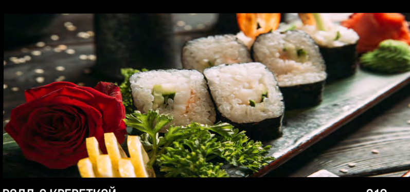
РОЛЛ С КРЕВЕТКОЙ.....219