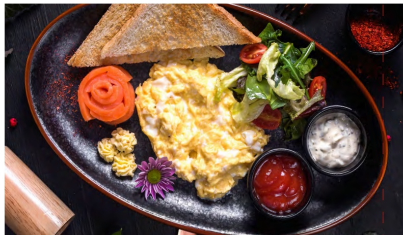
СКРЭМБЛ С ЛОСОСЕМ ..... 369