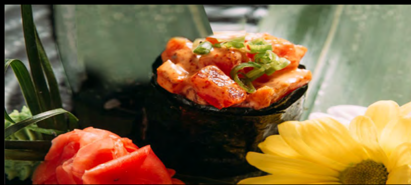
СПАЙСИ СУШИ С ТУНЦОМ ..... 149 ТУНЕЦ, СПАЙСИ СОУС, ЗЕЛЕНЬ ЛУК