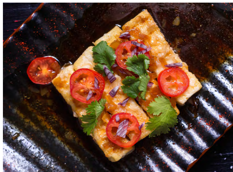
АГЭ-ТОФУ .....249 СЫР ТОФУ, ОБЖАРЕННЫЙ В СОЕВО-КУНЖУТНОМ СОУСЕ С ДОБАВЛЕНИЕМ КИНЗЫ И СПЕЦИЙ