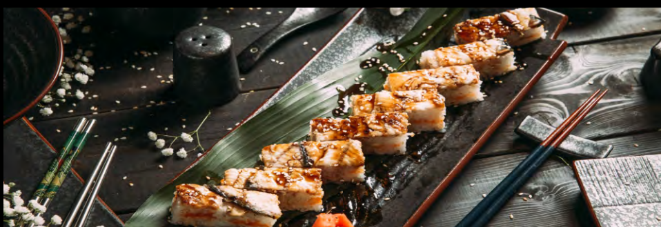
ОСИДЗУСИ С УГРЕМ ..... 599 СЫР ФИЛАДЕЛЬФИЯ, АВОКАДО, ТОБИКО, УГОРЬ, КУНЖУТ