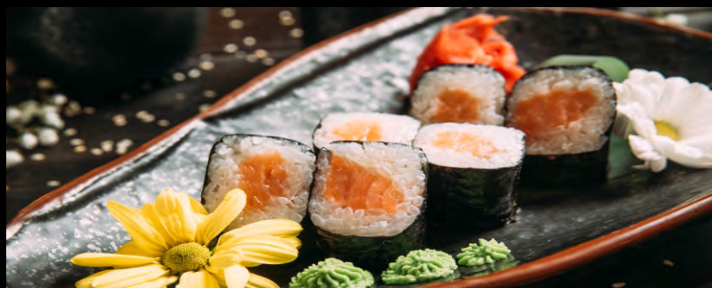
РОЛЛ С КОПЧЕНЫМ ЛОСОСЕМ .....369