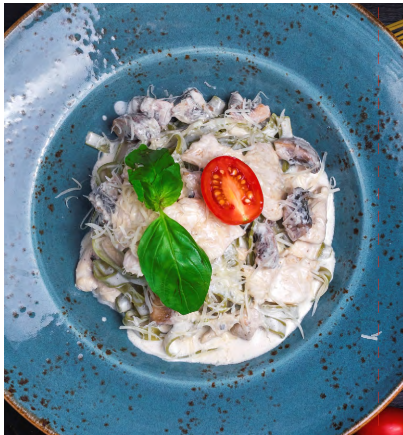
АЛЬФРЕДО .....339 ЛАПША ФЕТТУЧИНИ С КУРИНОЙ ГРУДКОЙ И ШАМПИНЬОНАМИ ПОД СЛИВОЧНЫМ СОУСОМ