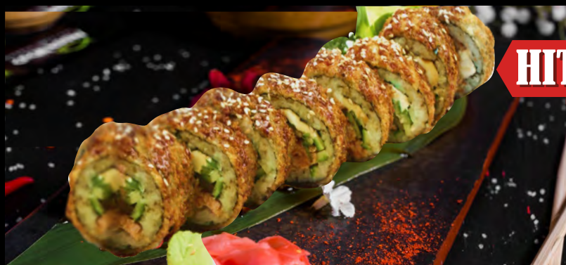
СУШИ РУУМ ..... 689 ЛОСОСЬ, УГОРЬ, АВОКАДО, ОГУРЕЦ, СЫР ФИЛАДЕЛЬФИЯ, ФИРМЕННЫЙ СОУС, КУНЖУТ