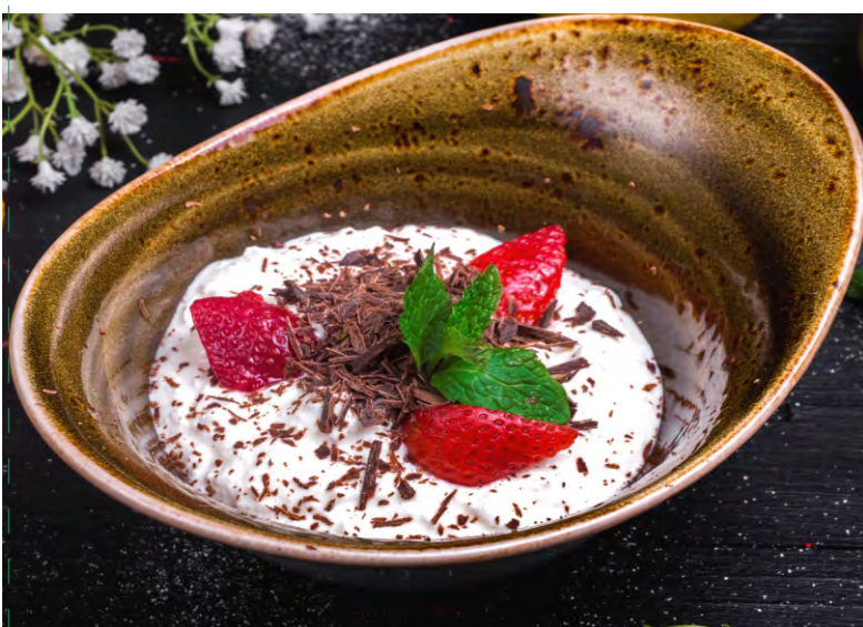
ТВОРОГ С ЯГОДОЙ И ШОКОЛАДОМ (по сезону).....249 ТВОРОГ С БАНАНОМ.....249