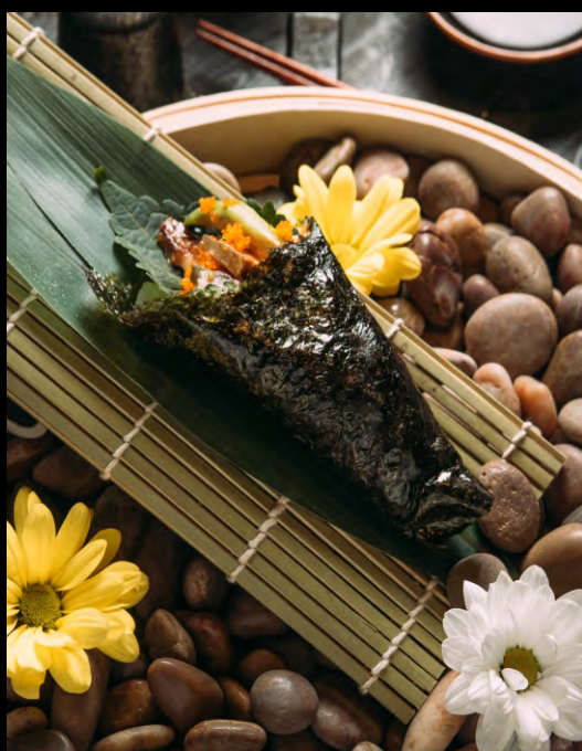
ТЭМАКИ С УГРЕМ.....349 ЛИСТ ШИСО, УГОРЬ, АВОКАДО, СПАЙСИ СОУС, ТОБИКО