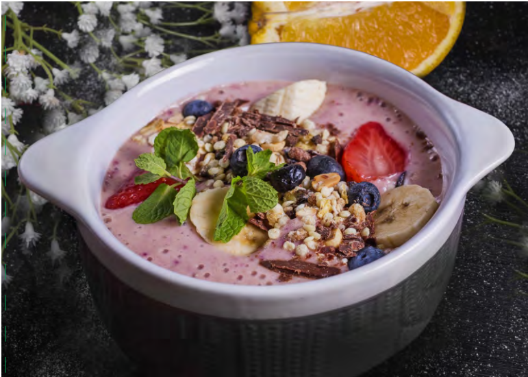
АСАИ БОУЛ.....309 СМУЗИ НА МИНДАЛЬНОМ МОЛОКЕ С ГРАНОЛОЙ, БАНАНОМ И ЯГОДОЙ

ВАША ЛЮБИМАЯ КАША: НА МОЛОКЕ / НА ВОДЕ ДО 17:00