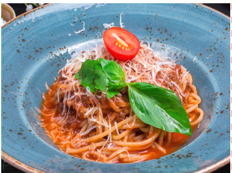
БОЛОНЕЗЕ .....359 СПАГЕТТИ С ТУШЕНЫМ ГОВЯЖЬИМ ФАРШЕМ ПОД ТОМАТНЫМ СОУСОМ