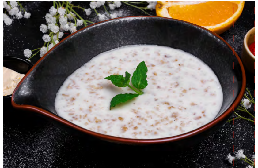
КАША ОВСЯНАЯ / РИСОВАЯ / ГРЕЧНЕВАЯ.....189 СО СЛИВОЧНЫМ МАСЛОМ