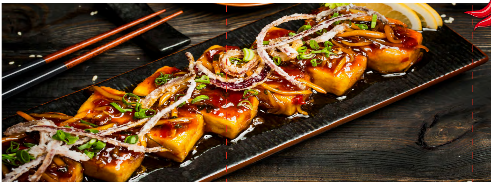
ТОФУ В ИМБИРНОМ СОУСЕ, ЧЕСНОКОМ И ПЕРЦЕМ HOT ЧИЛИ