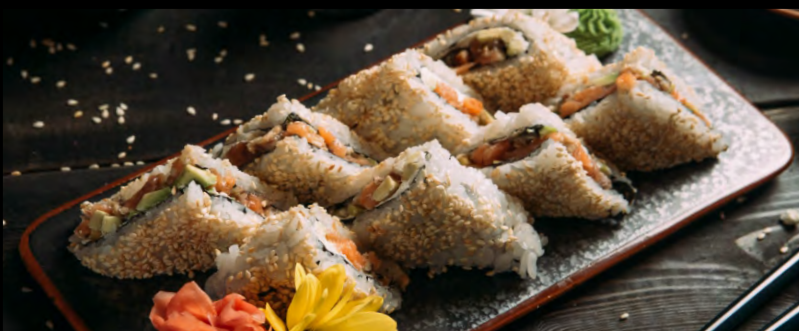
СЯКЕ САНДОЧИ ..... 479 АВОКАДО, ЛОСОСЬ, УГОРЬ, СЫР ФИЛАДЕЛЬФИЯ, КУНЖУТ