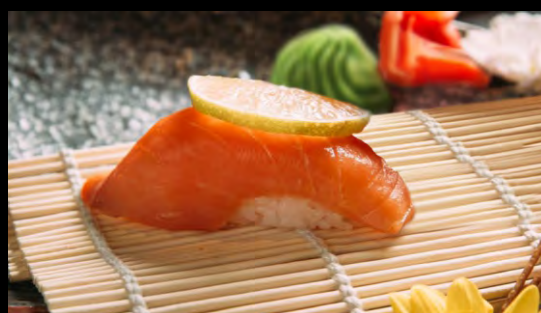
СУШИ КОПЧЕНЫЙ ЛОСОСЬ ..... 149