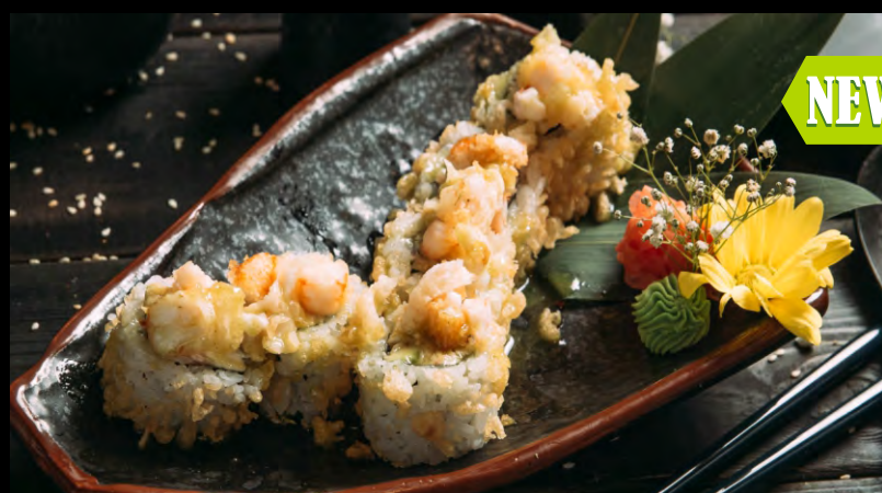
ЗБИ ЧИЗ ..... 989 КРАБОВЫЙ МИХ, АВОКАДО, СЫР ФИЛАДЕЛЬФИЯ, ЧЕСНОК