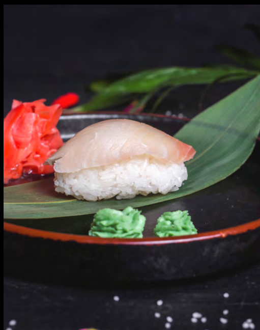
СУШИ ОКУНЬ..... 119