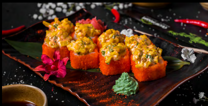
ХОТ РОЛЛ ..... 629 СЫР ФИЛАДЕЛЬФИЯ, ТОБИКО, ТАМАГО, УГОРЬ, ЛУК ЗЕЛЕНЬИЙ, СОУС ФИРМЕННЫЙ