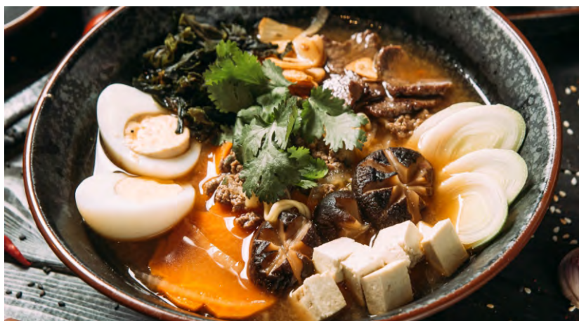
РАМЕН С ГОВЯДИНОЙ .....479