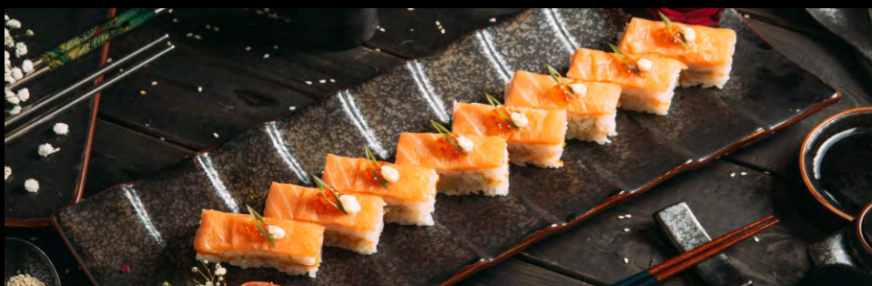
ОСИДЗУСИ С ЛОСОСЕМ ..... 549 СЫР ФИЛАДЕЛЬФИЯ, АВОКАДО, ТОБИКО, ЛОСОСЬ, ИКРА ЛОСОСЯ, ЗЕЛЕНЬ ЛУК