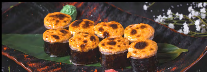
ИЗУМИТАЙ ..... 449 РОЛЛ ТИГРОВЫЕ КРЕВЕТКИ, ОКУНЬ, СОУС ФИРМЕННЫЙ