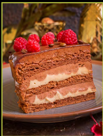
АНГЕЛ КОФЕЙНЫЙ 290