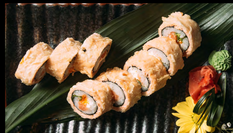
ФИЛАДЕЛЬФИЯ ТЕМПУРА РОЛЛ {ГОРЯЧИЙ} ..... 979 ЛОСОСЬ КОПЧЕНЫЙ, СЫР ФИЛАДЕЛЬФИЯ, ТОБИКО, ЛИСТ РОМЕЙН