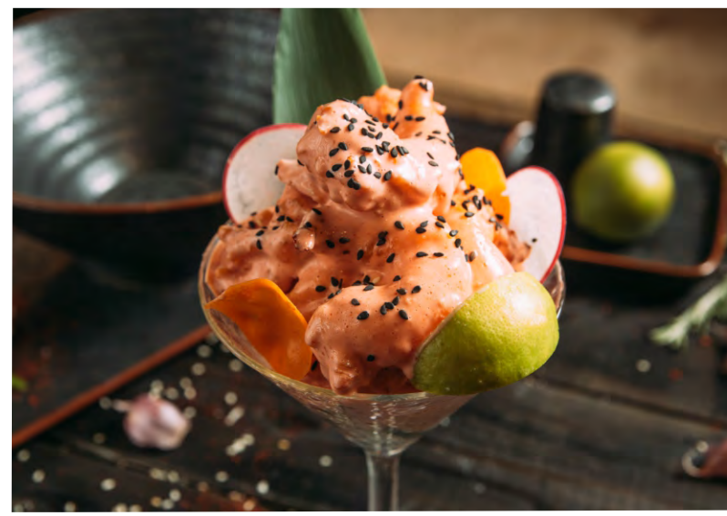
КРЕВЕТКИ ДИНАМИТ .....559 ЖАРЕННЫЕ ХРУСТЯЩИЕ КРЕВЕТКИ В КЛЯРЕ, В ФИРМЕННОМ ОСТРОМ СОУСЕ ДИНАМИТ