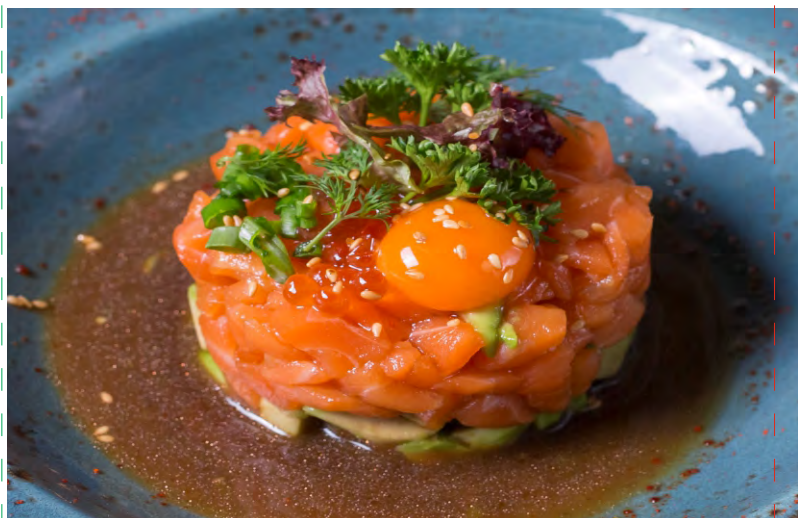
ТАР-ТАР ИЗ ЛОСОСЯ / ТАР-ТАР ИЗ ТУНЦА С КУСОЧКАМИ АВОКАДО В СОУСЕ ПОНЗУ