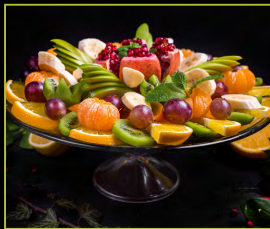
ФРУКТОВОЕ АССОРТИ /ПО СЕЗОНУ/ 650