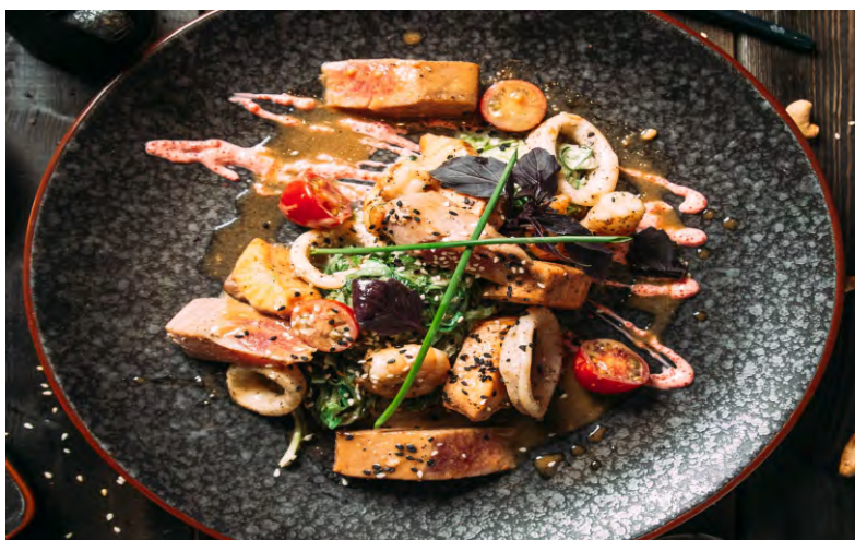
САЛАТ С ТУНЦОМ, КРЕВЕТКАМИ И ПОМИДОРАМИ ЧЕРРИ, ЗАПРАВЛЕННЫЙ КИСЛО-СЛАДКИМ СОУСОМ .....979