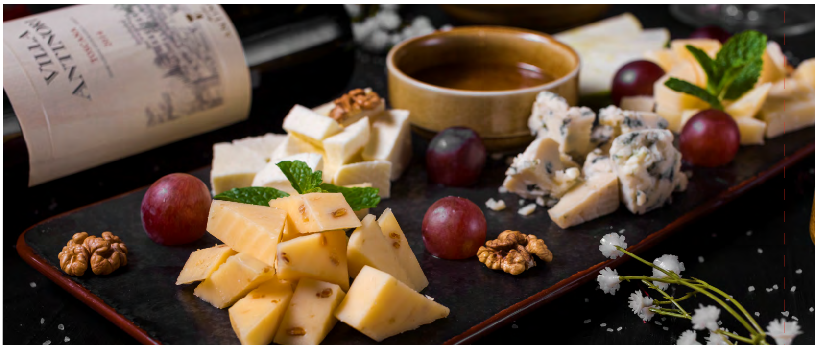
СЫРНОЕ АССОРТИ ОРЕХОВЫЙ СЫР, ГРАНО ПОДАНО, ДОР БЛЮ, МОЦАРЕЛЛА В РАССОЛЕ, МЕД, УКРАШАЕТСЯ ВИНОГРАДОМ, ГРЕЦКИМИ ОРЕХАМИ И ЯБЛОКАМИ