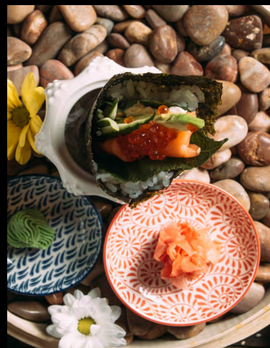
ТЭМАКИ С ЛОСОСЕМ.....379 ЛИСТ ШИСО, ОГУРЦЫ, ЛОСОСЬ, СЫР ФИЛАДЕЛЬФИЯ, АВОКАДО, ИКРА ЛОСОСЯ