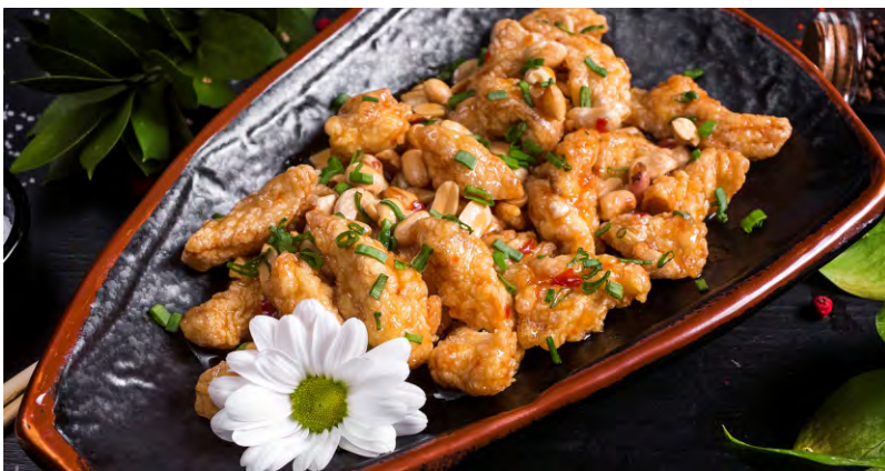
КУРИЦА ВОК С АРАХИСОМ .....379 КУРИНОЕ ФИЛЕ, ОБЖАРЕННОЕ ДО ХРУСТЯЩЕЙ КОРОЧКИ С АРАХИСОМ, ЗАПРАВЛЕННОЕ КИСЛО-СЛАДКИМ СОУСОМ