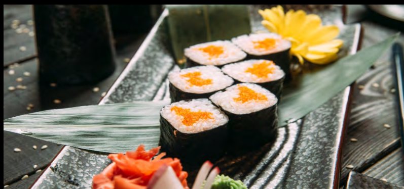
РОЛЛ С ТОБИКО.....289