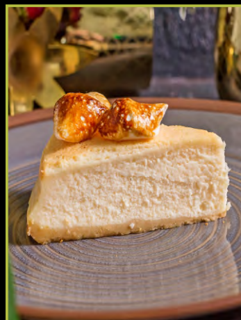
ЧИЗКЕЙК НЬЮ-ЙОРК 250