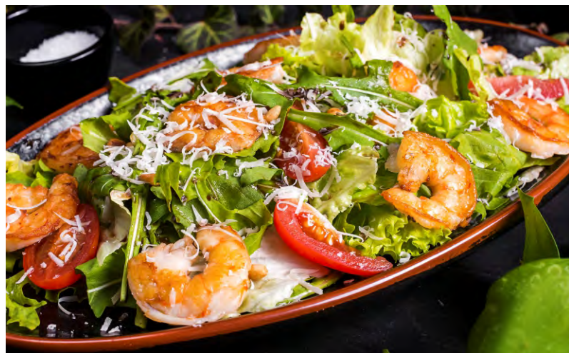
САЛАТ С КРЕВЕТКАМИ .....629