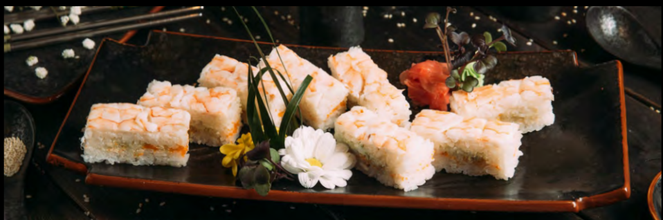
ОСИДЗУСИ С КРЕВЕТКОЙ ..... 579 СЫР ФИЛАДЕЛЬФИЯ, АВОКАДО, ТОБИКО, КРЕВЕТКА