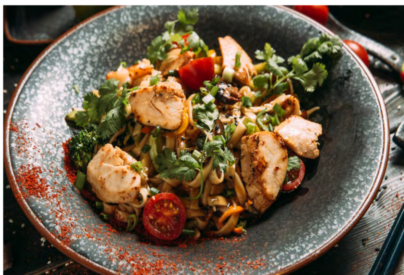
УДОН С КУРИЦЕЙ .....379 УДОН С ГОВЯДИНОЙ .....449