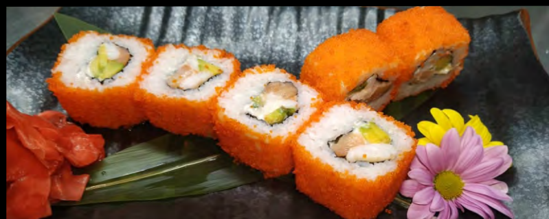
МИСАТО РОЛЛ ..... 599 КОПЧЕНЫЙ ЛОСОСЬ, АВОКАДО, ЛУК ЗЕЛЕНЬ, ТОБИКО