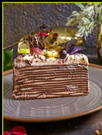
БЛИННЫЙ БРАУНИ 320