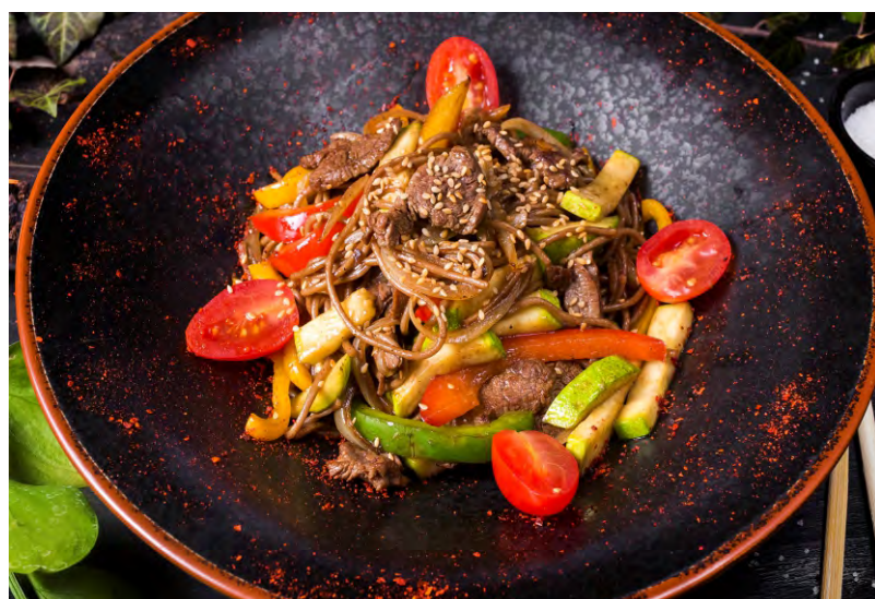
СОБА С КУРИЦЕЙ .....379 СОБА С ГОВЯДИНОЙ .....479