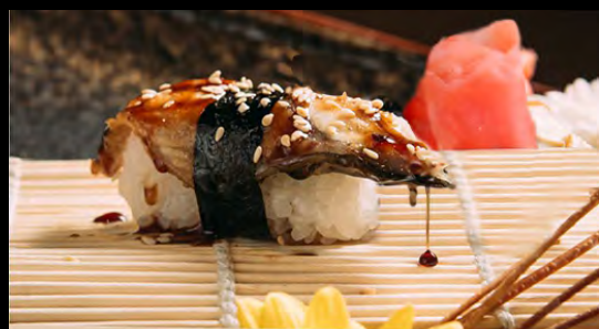
СУШИ УГОРЬ..... 149