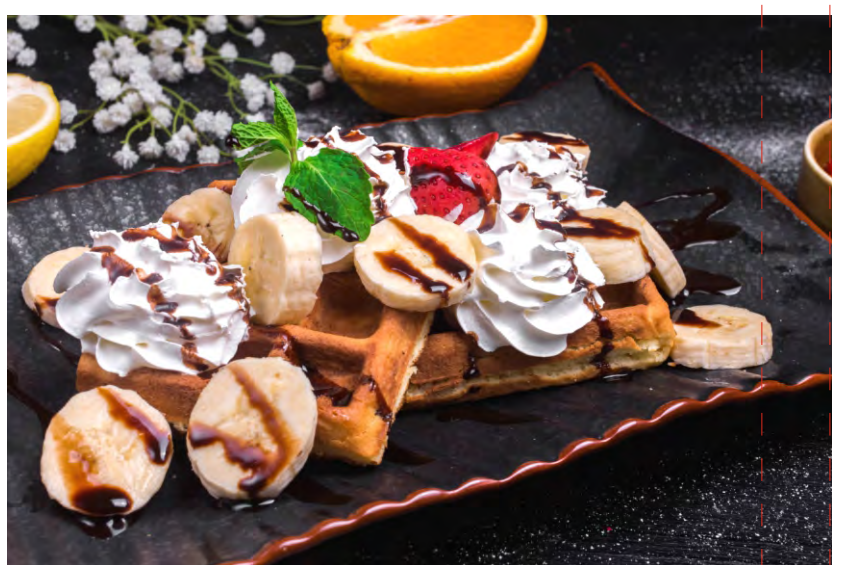
БЕЛЬГИЙСКИЕ ВАФЛИ С БАНАНОМ И ВЗБИТЫМИ СЛИВКАМИ, ЯГОДАМИ И МОРОЖЕНЫМ.....219