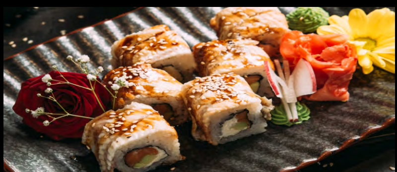
УНАГИ РОЛЛ ..... 619 УГОРЬ КОПЧЕНЫЙ, РИС, ЛОСОСЬ, ОГУРЕЦ, СЫР ФИЛАДЕЛЬФИЯ