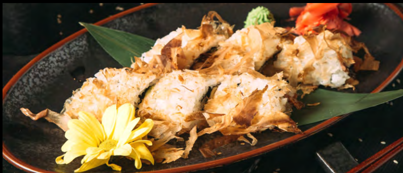
ОВАРО РОЛЛ ..... 509 УГОРЬ, АВОКАДО, СЫР ФИЛАДЕЛЬФИЯ, СТРУЖКА ТУНЦА