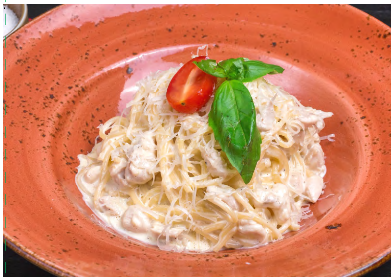
СПАГЕТТИ КАРБОНАРА С КУРИЦЕЙ .....379 СПАГЕТТИ С КУРИНОЙ ГРУДКОЙ ПОД СЛИВОЧНЫМ СОУСОМ