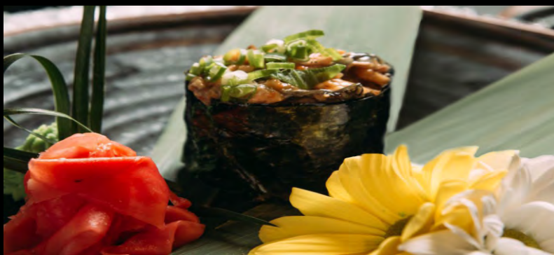
СПАЙСИ СУШИ С УГРЕМ ..... 149 УГОРЬ, СПАЙСИ СОУС, ЗЕЛЕНЬ ЛУК