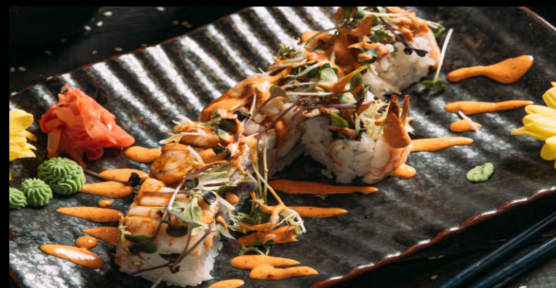
ЭБИ ТЕМПУРА РОЛЛ ..... 979 АВОКАДО, КРЕВЕТКИ В ТЕМПУРЕ, КРАБОВЫЙ МИХ