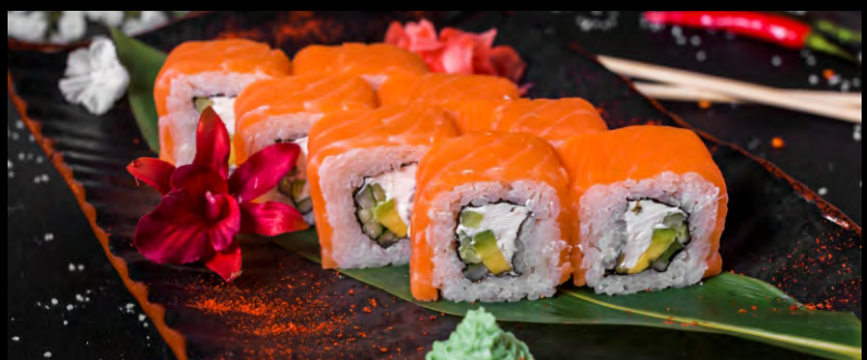
ФИЛАДЕЛЬФИЯ ГРИН ..... 609 ЛОСОСЬ, СЫР ФИЛАДЕЛЬФИЯ, ОГУРЕЦ, АВОКАДО