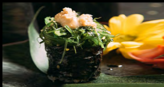
СУШИ ЧУКА..... 129