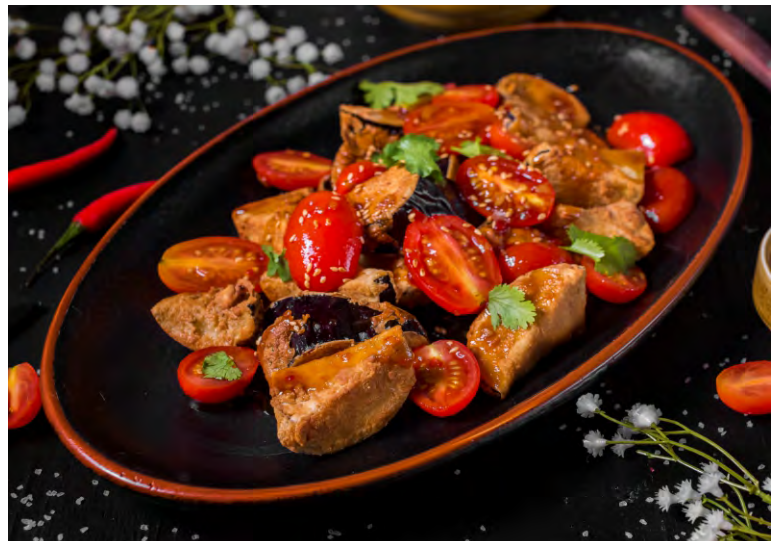
САЛАТ ИЗ БАКЛАЖАНОВ В КИТАЙСКОМ СТИЛЕ .....389 ХРУСТЯЩИЕ КУСОЧКИ БАКЛАЖАНА С ПОМИДОРАМИ ЧЕРРИ, ЗАПРАВЛЕННЫЕ ФИРМЕННЫМ СОУСОМ