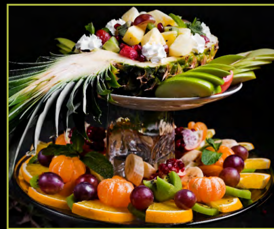
ФРУКТОВОЕ АССОРТИ С АНАНАСОМ 850 /ПО СЕЗОНУ/