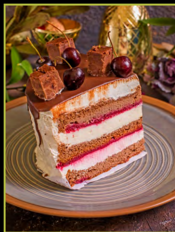
ВИШНЯ ШОКОЛАД 290