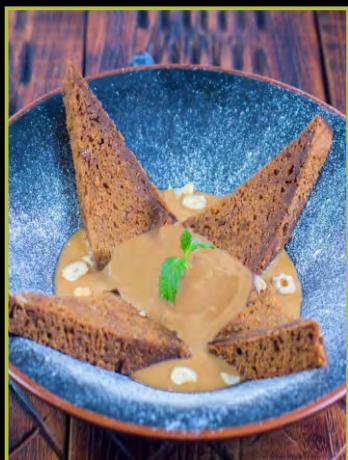
ИНЖИРНЫЙ ПИРОГ 290 С КАРАМЕЛЬНЫМ СОУСОМ