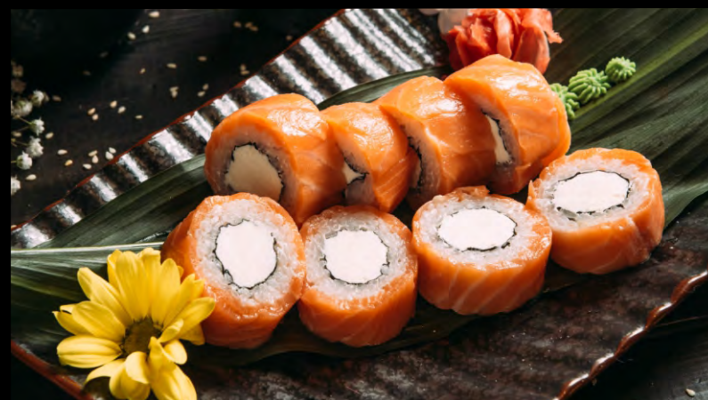
ФИЛАДЕЛЬФИЯ РОЛЛ ..... 619 СЫР ФИЛАДЕЛЬФИЯ, ЛОСОСЬ