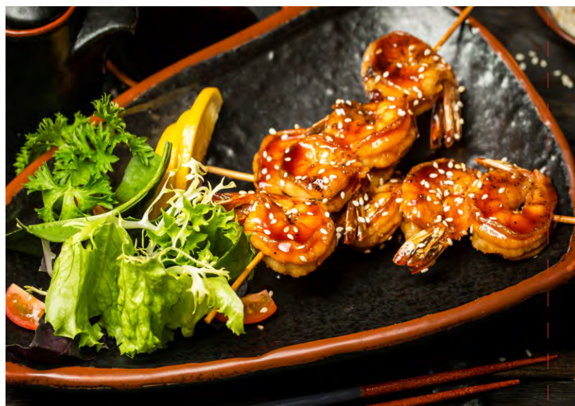
ШАШЛЫЧКИ ЭБИ.....449 В СОУСЕ ТЕРИЯКИ