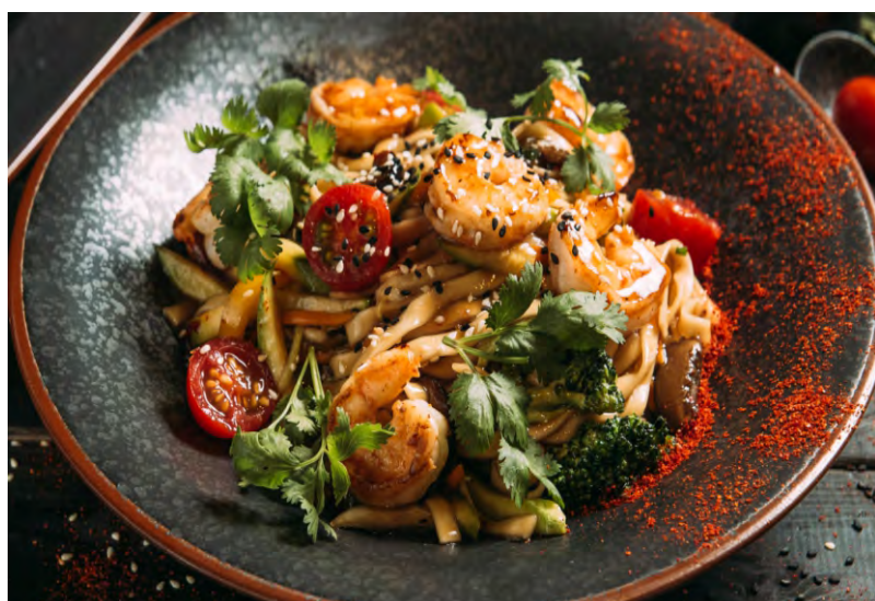
УДОН С КРЕВЕТКАМИ .....479