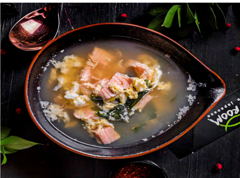
СУП ДЗОСУЙ С ЛОСОСЕМ ..... 289 ОРИГИНАЛЬНЫЙ СУП С НЕЖНЫМ ЛОСОСЕМ, ВЗБИТЫМ ЯЙЦОМ И ВОДОРОСЛЯМИ ВАКАМЭ