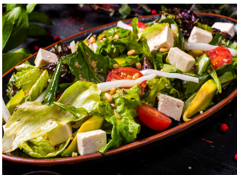
ТОФУ МИКС-САЛАТ .....359 САЛАТ С ТОФУ, МИКС-САЛАТОМ И КИНОА