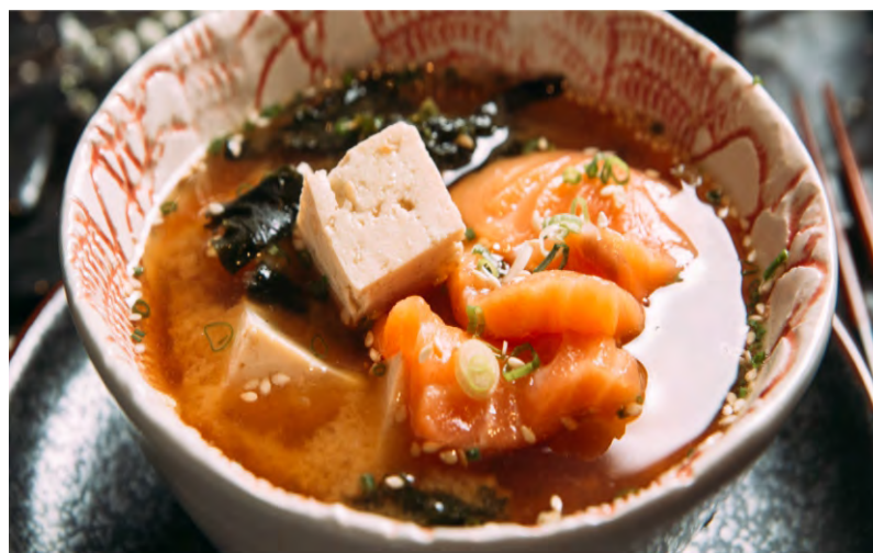
МИСО СУП КЛАССИЧЕСКИЙ ..... 199 С КРЕВЕТКАМИ..... 289 С ЛОСОСЕМ ..... 319