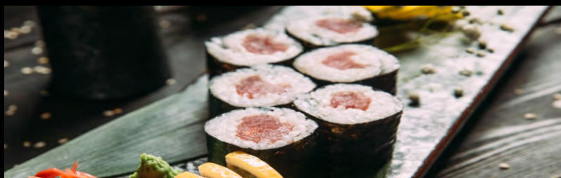
РОЛЛ С ТУНЦОМ .....389