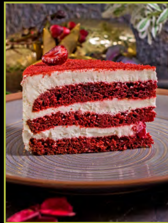
RED VELVET 220