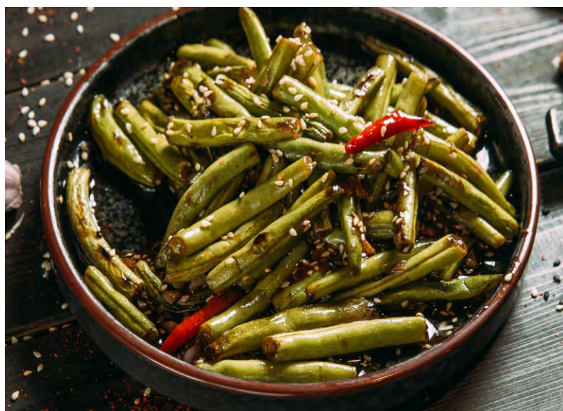
ЖАРЕНАЯ ФАСОЛЬ С КУНЖУТОМ .....219