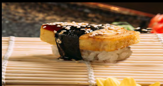
СУШИ ТОМАГО ..... 119