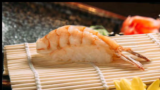
СУШИ КРЕВЕТКА..... 129