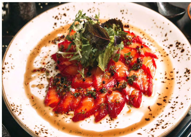
КАРПАЧЧО ИЗ ЛОСОСЯ .....719