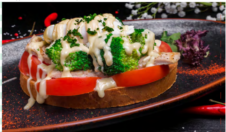
ЗАВТРАК ДЖЕЙМИ ОЛИВЕРА ..... 279 ЗАВТРАК С КУРИНОЙ ГРУДКОЙ, БРОККОЛИ, ЯЙЦОМ ПАШОТ, СОУСОМ ЦЕЗАРЬ