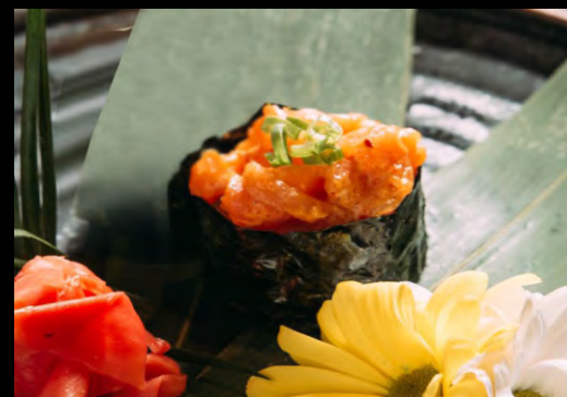
СПАЙСИ СУШИ С КОПЧЕНЫМ ЛОСОСЕМ ..... 179 КОПЧЕНЫЙ ЛОСОСЬ, СПАЙСИ СОУС, ЗЕЛЕНЬ ЛУК