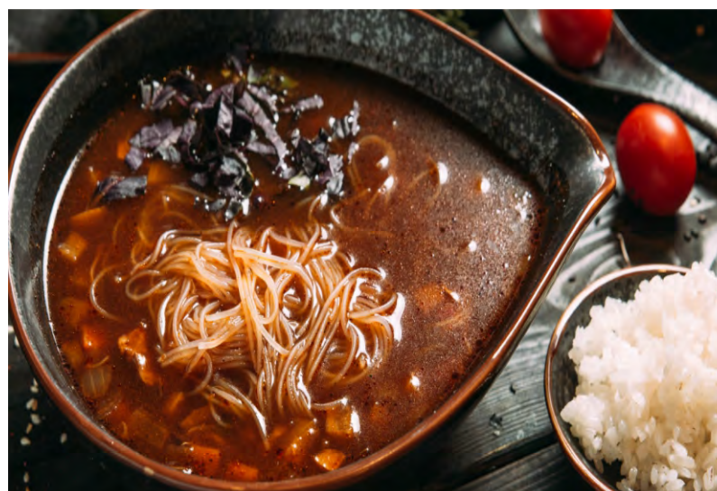
ОСТРЫЙ КИТАЙСКИЙ СУП ..... 349 С ГОВЯДИНОЙ И КУРИНЫМ ФИЛЕ, РИСОВОЙ ЛАПШОЙ, ПРОРОСШИМИ БОБАМИ, БОЛГАРСКИМ ПЕРЦЕМ, КАРТОФЕЛЕМ, МОРКОВЬЮ, ПЕРЦЕМ ЧИЛИ И ДРЕВЕСНЫМИ ГРИБАМИ