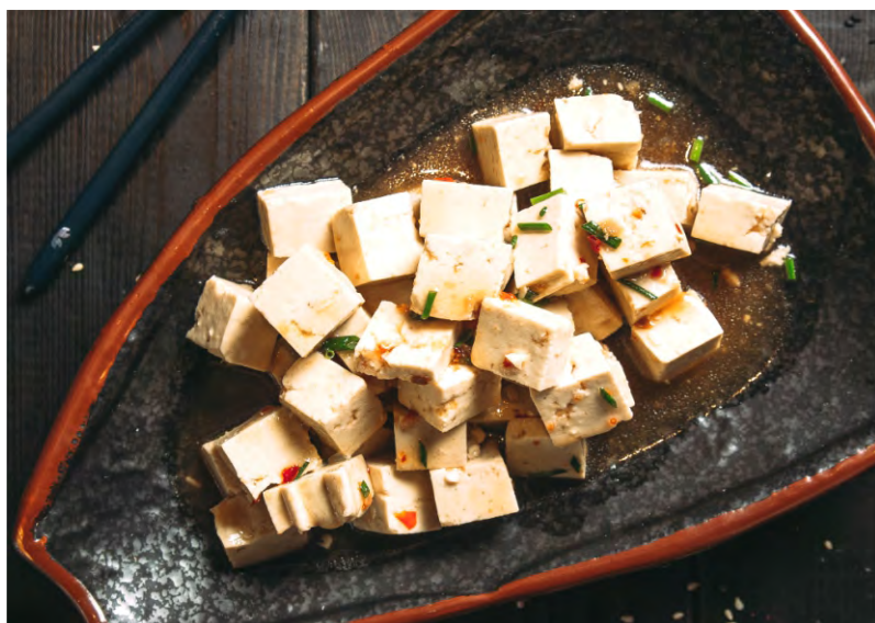
САЛАТ С ТОФУ, ЗАПРАВЛЕННЫЙ КИСЛО-СЛАДКИМ СОУСОМ.....179