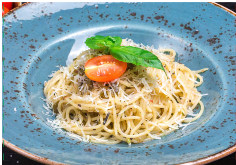
ПАСТА АЛИО ОЛИО .....269 СПАГЕТТИ, ПЕРЕЦ ХАЛАПЕНЬО, ЧЕСНОК, РЕПЧАТЫЙ ЛУК, РОЗМАРИН, ОЛИВКОВОЕ МАСЛО, ПОД СОУСОМ ПАРМЕЗАН