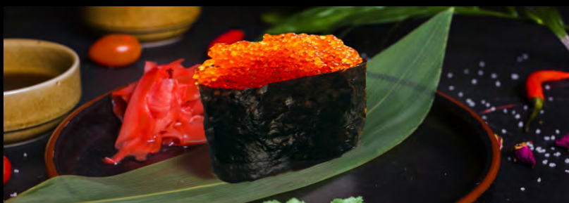
СУШИ ТОБИКО..... 129