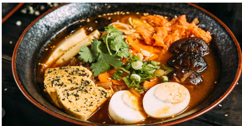
РАМЕН КИМЧИ .....489