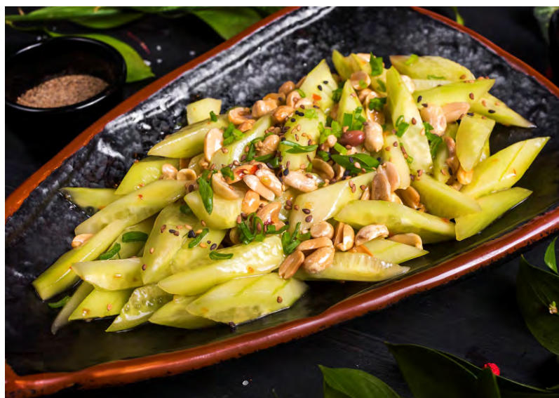
САЛАТ С ОГУРЦОМ И АРАХИСОМ,.....289 ЗАПРАВЛЕННЫЙ КИСЛО-СЛАДКИМ СОУСОМ И КУНЖУТНЫМ МАСЛОМ