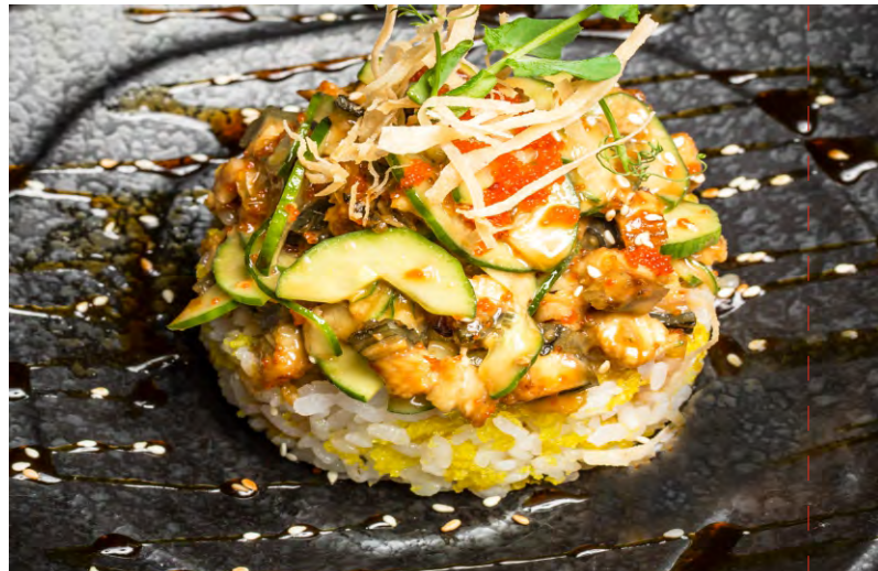
СУШИ ТАУЭР УГОРЬ, ОГУРЕЦ В СЛАДКОМ СОУСЕ С ХРУСТЯЩИМ РИСОМ