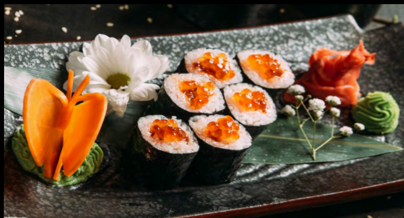
РОЛЛ С ИКРОЙ ЛОСОСЯ .....369