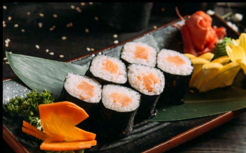
РОЛЛ С ЛОСОСЕМ.....369