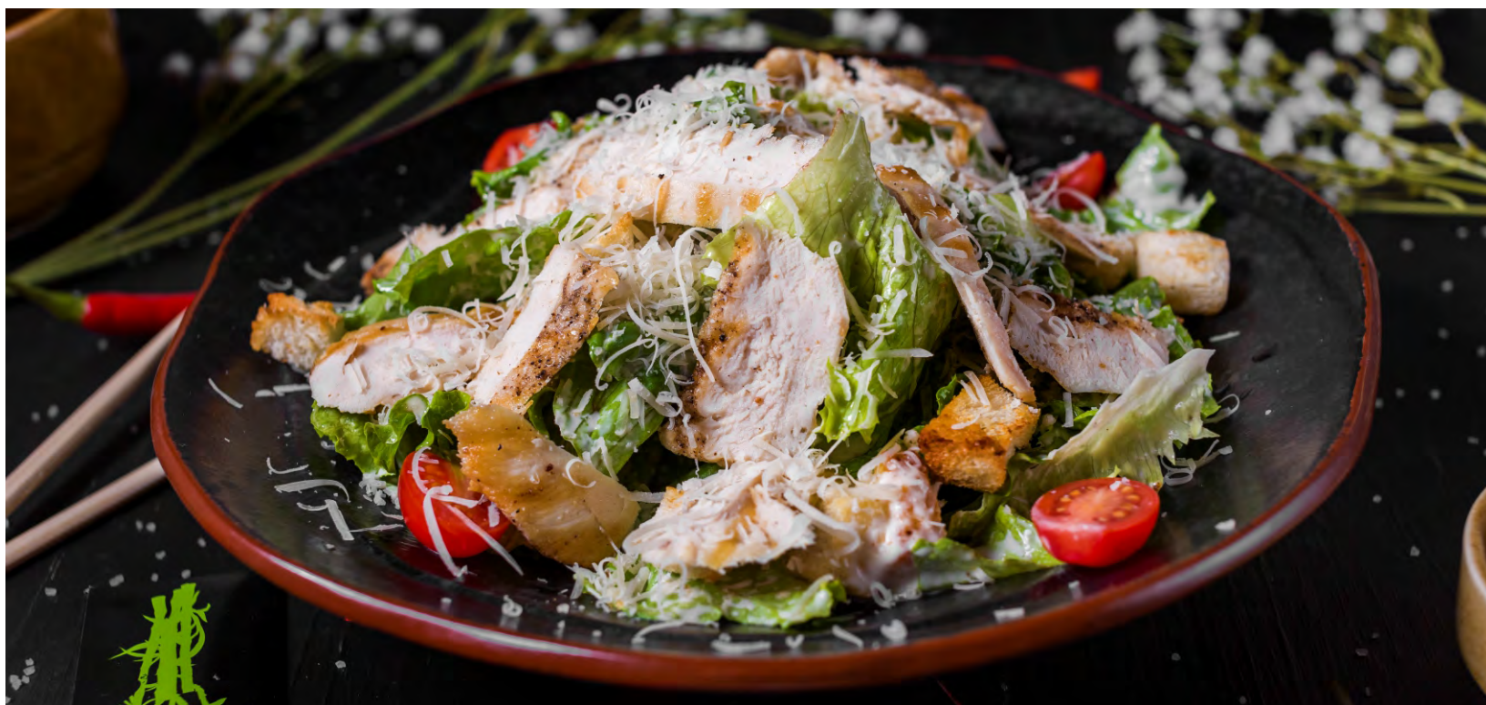
ЦЕЗАРЬ С КУРИЦЕЙ .....419 ЛИСТЬЯ САЛАТА, ЧЕСНОЧНЫЕ КРУТОНЫ С ЖАРЕНОЙ КУРИНОЙ ГРУДКОЙ, ПОМИДОРАМИ ЧЕРРИ, С СЫРОМ ПАРМЕЗАН, ЗАПРАВЛЕННЫЙ СОУСОМ ЦЕЗАРЬ