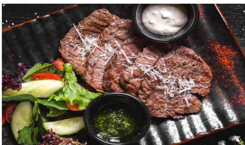
НЕЖНОЕ ФИЛЕ МИНЬОН ЖАРЕНОЕ НА ГРИЛЕ .....579 С МИКС-САЛАТОМ, С СОУСОМ ТАР-ТАР И ПЕСТО