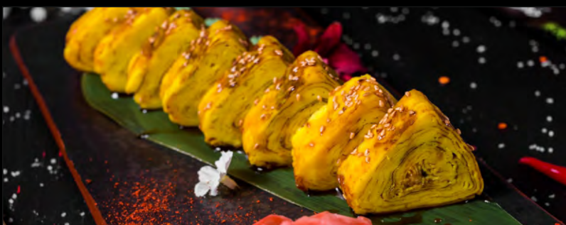
ТАМАГО РОЛЛ ..... 549 РОЛЛ ИЗ ЯПОНСКОГО ОМЛЕТА С УГРЕМ И СОУСОМ УНАГИ, КУНЖУТ