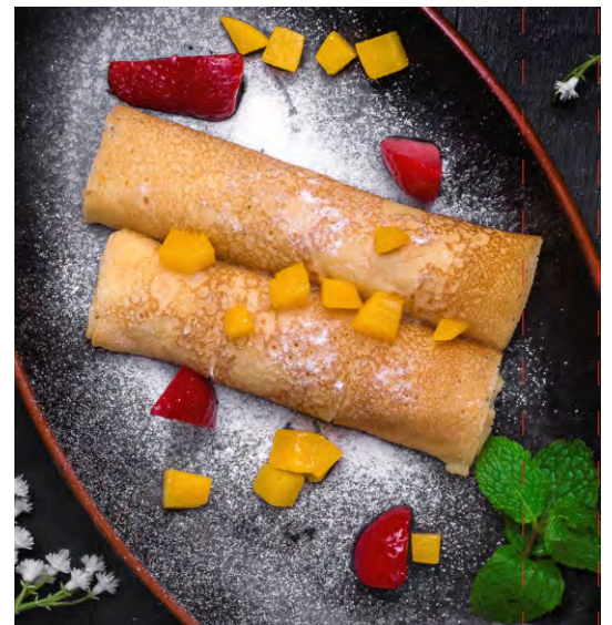
БЛИНЫ С НЕЖНЫМ ТВОРОГОМ И ПЕРСИКОМ.....249