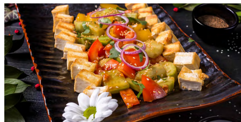
ШАШЛЫЧКИ ИЗ ТОФУ .....299 С ОВОЩАМИ