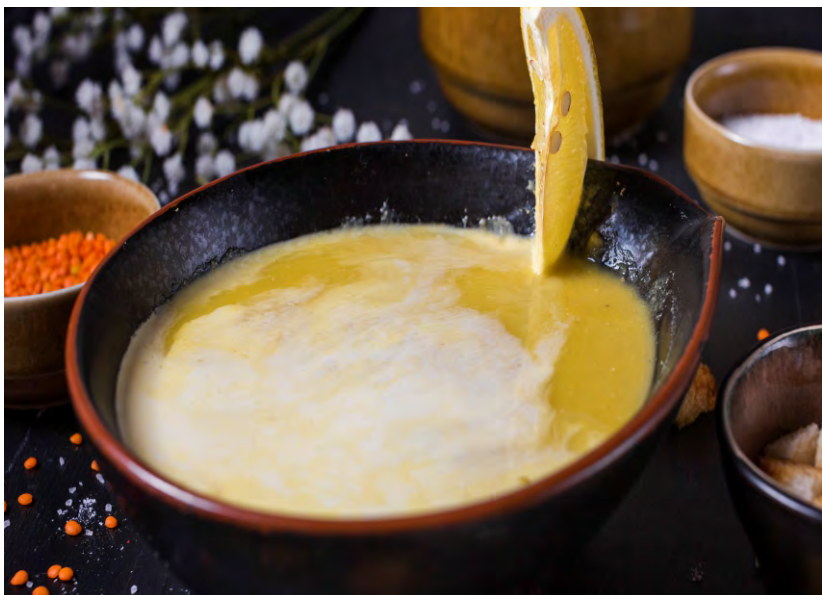
СУП ЧЕЧЕВИЧНЫЙ..... 209