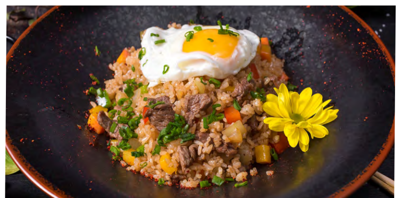
ТЯХАН С КУРИЦЕЙ .....349 РИС С КУСОЧКАМИ КУРИНОГО ФИЛЕ, ОВОЩАМИ, ЧЕСНОЧНЫМ СОУСОМ И СОУСОМ КИМЧИ С ГОВЯДИНОЙ .....399 С ЛОСОСЕМ .....439 С КРЕВЕТКАМИ .....459