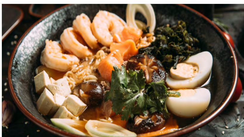
РАМЕН С КРЕВЕТКАМИ И ЛОСОСЕМ .....589