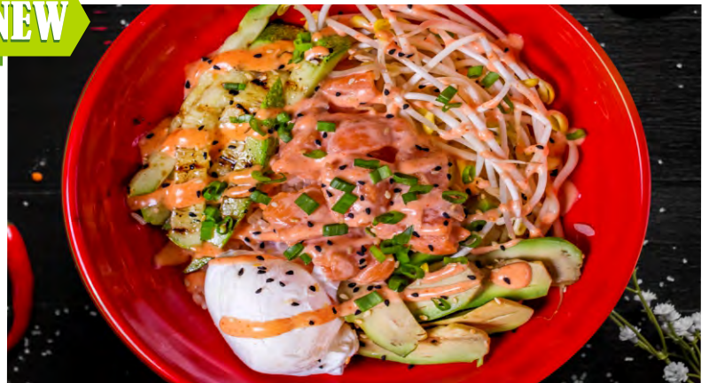
ПОКЕ С ЛОСОСЕМ 449 / С УГРЕМ 479 / С КРЕВЕТКАМИ 469