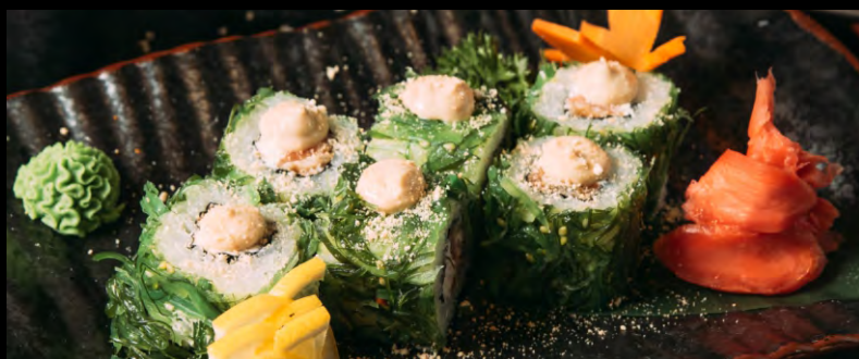
ЧУКА МАКИ РОЛЛ ..... 549 УГОРЬ КОПЧЕНЫЙ, АВОКАДО, ЛОСОСЬ, СЫР ФИЛАДЕЛЬФИЯ, ЧУКА С ОРЕХОВЫМ СОУСОМ