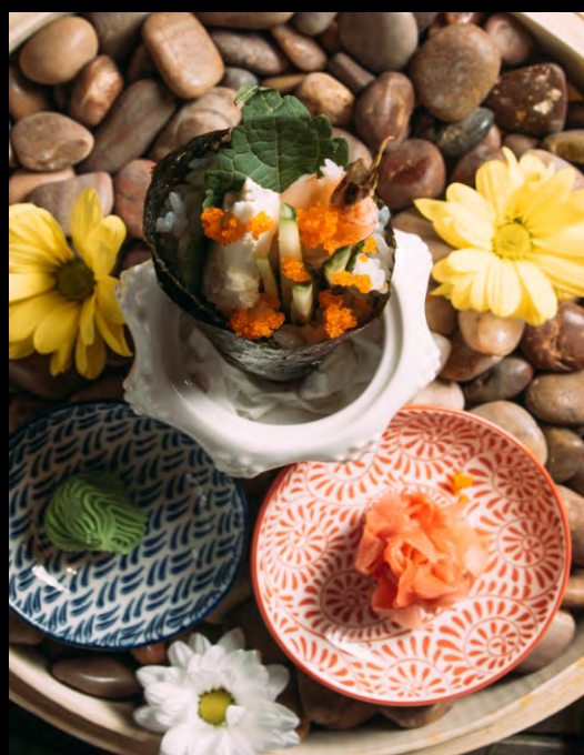
ТЭМАКИ С КРЕВЕТКОЙ.....349 ЛИСТ ШИСО, КРЕВЕТКА, ОГУРЦЫ, ЧЕСНОЧНЫЙ СЫР, ТОБИКО