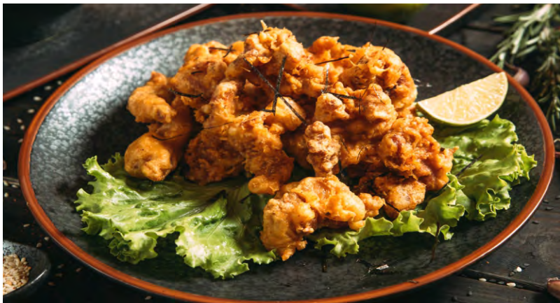
КАРЕ АГЕ .....289 НЕЖНЫЕ ХРУСТЯЩИЕ КУСОЧКИ КУРИЦЫ В ОСТРОМ КЛЯРЕ, В КИСЛО- СЛАДКОМ МАРИНАДЕ