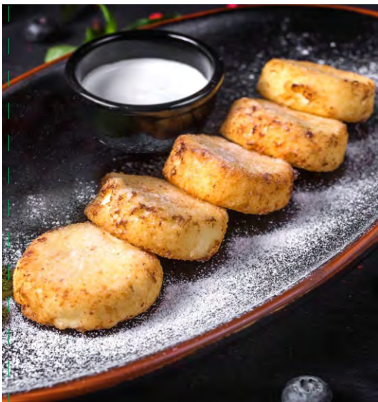
СЫРНИКИ СО СМЕТАНОЙ.....229