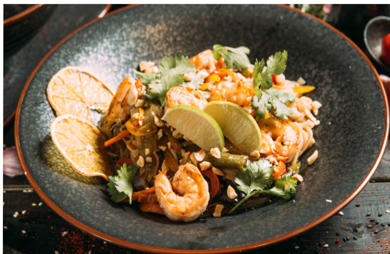
ПАД ТАЙ С КРЕВЕТКАМИ .....539 РИСОВАЯ ЛАПША С КРЕВЕТКАМИ, ОВОЩАМИ И СОУСОМ ПАД ТАЙ ПАД ТАЙ С КУРИЦЕЙ .....419 РИСОВАЯ ЛАПША С ОВОЩАМИ И СОУСОМ ПАД ТАЙ