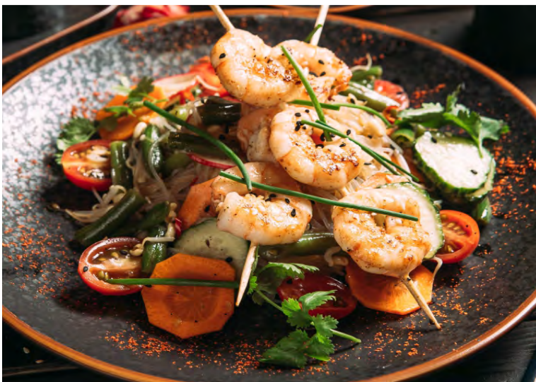
САЛАТ С КРЕВЕТКАМИ НА ШПАЖКАХ.....379 В КИСЛО-СЛАДКОМ СОУСЕ, С ПРОРОСШИМИ БОБАМИ, МОРКОВЬЮ, РЕДИСОМ И ПОМИДОРАМИ ЧЕРРИ