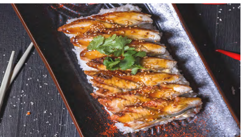
УНАТАМА ДЗЮ .....669 УГОРЬ НА РИСЕ