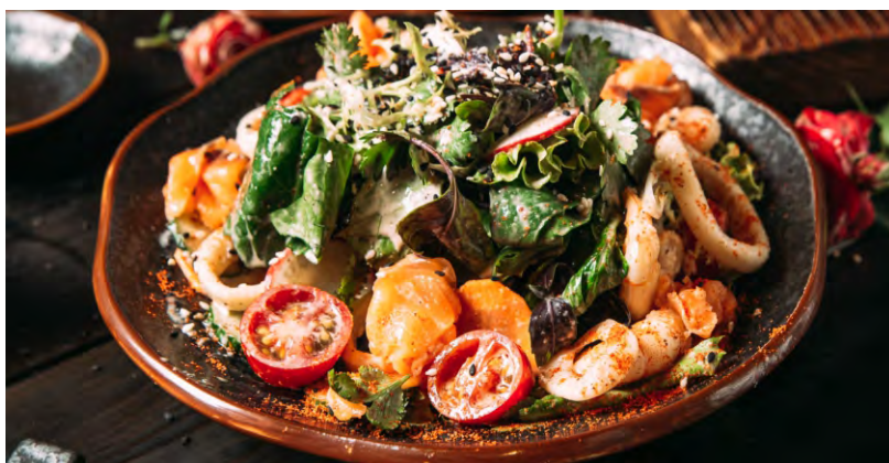
САЛАТ КАЙСЕН .....519 С АТЛАНТИЧЕСКИМ КАЛЬМАРОМ, МАЛОСОЛЬНЫМ ЛОСОСЕМ И ЖАРЕНЫМИ КРЕВЕТКАМИ, С МИКСОМ ИЗ ЛИСТЬЕВ САЛАТА, ЗАПРАВЛЕННЫЙ СОУСОМ КАЙСЕН (НА ОСНОВЕ СОЕВОГО СОУСА И РИСОВОГО УКСУСА)