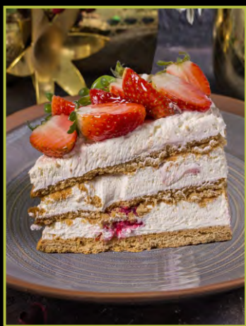
ME TO YOU 350