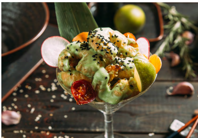
КРЕВЕТКИ ВАСАБИ .....549 ЖАРЕННЫЕ ХРУСТЯЩИЕ КРЕВЕТКИ В КЛЯРЕ, В ФИРМЕННОМ СОУСЕ С ДОБАВЛЕНИЕМ ВАСАБИ