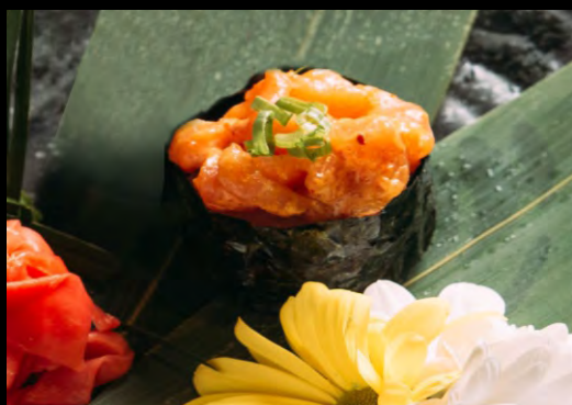
СПАЙСИ СУШИ С ЛОСОСЕМ ..... 159 ЛОСОСЬ, СПАЙСИ СОУС, ЗЕЛЕНЬ ЛУК