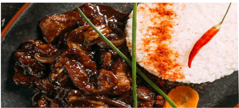
ГОВЯДИНА С РИСОМ .....489 ЖАРЕНОЕ МЯСО ГОВЯДИНЫ В ВОК С ЛУКОМ, С ДОБАВЛЕНИЕМ СОЕВОГО УКСУСА, ПОДАЕТСЯ С РИСОМ