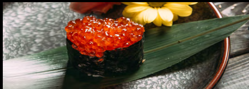
СУШИ ИКРА ЛОСОСЯ..... 149