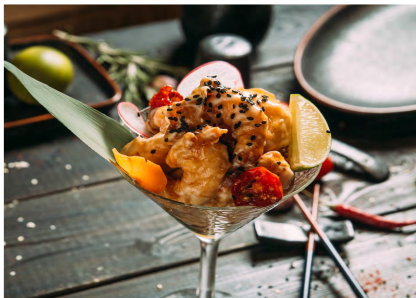
КРЕВЕТКИ ИМБИРНЫЕ .....569 ХРУСТЯЩИЕ КРЕВЕТКИ В КЛЯРЕ В БЕЛОМ СЛАДКОМ СОУСЕ И КИСЛОМ СОУСЕ, С ДОБАВЛЕНИЕМ СОКА ЛАЙМА