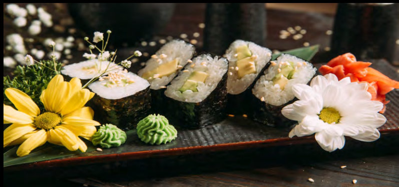
РОЛЛ С АВОКАДО.....199